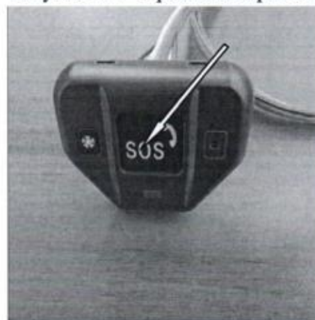
Рисунок А.6 – Кнопка вызова экстренных оперативных служб