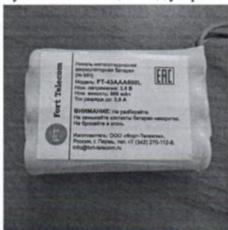
Рисунок А.3 - Резервный источник питания