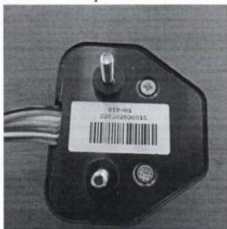
Рисунок А.5 – Блок интерфейса пользователя