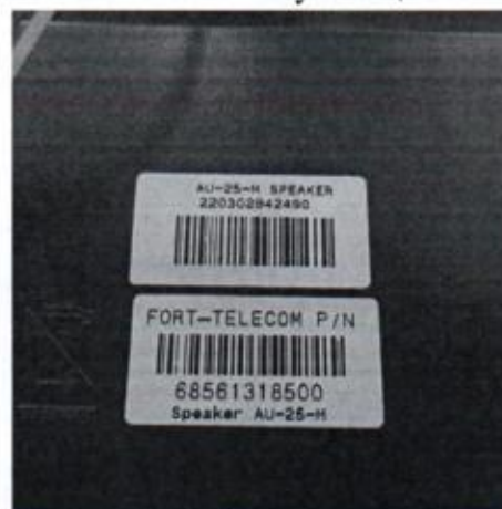
Рисунок А.4 - Громкоговоритель