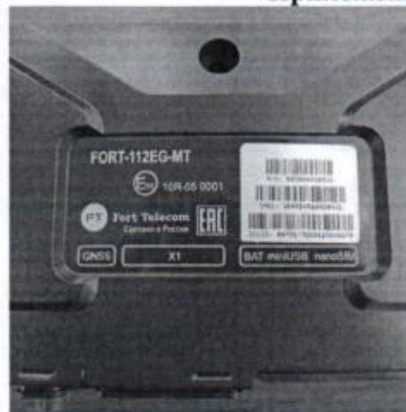
Рисунок А.2 – Телекоммуникационный блок